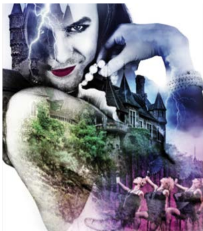
Motiv: Look/one gmbh

»Ich würde Sie gerne – wenn Sie gestatten – mit auf eine geheimnisvolle Reise nehmen. Es schien eine ganz normale Nacht zu sein, als Brad Majors und seine Verlobte Janet Weiß – zwei ganz gesunde, normale junge Leute – an einem späten Novemberabend Denton verließen, um einen gewissen Dr. Everett Scott zu besuchen, der früher ihr Naturwissenschaftsprofessor und ihnen jetzt ein Freund war. Es stimmt, dass vor ihnen dunkle Gewitterwolken lagen, die schwarz und tief herabhingen, und auf die sie zusteueren. Es stimmt auch, dass der Ersatzreifen, den sie mit sich führten, dringend etwas Luft nötig gehabt hätte ... Aber, sie waren ja nur ein paar ganz normale Leute auf einem Ausflug – und – wer würde sich den schon von einem Unwetter verderben lassen?